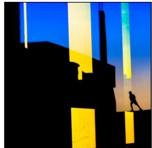
Primer Premio XVI Edición: Ulises Salom